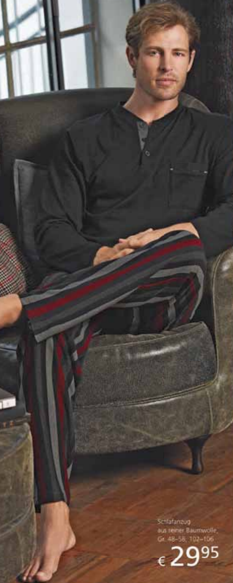
Schlafanzug aus reiner Baumwolle, Gr. 48-58, 102-106 € 29 95