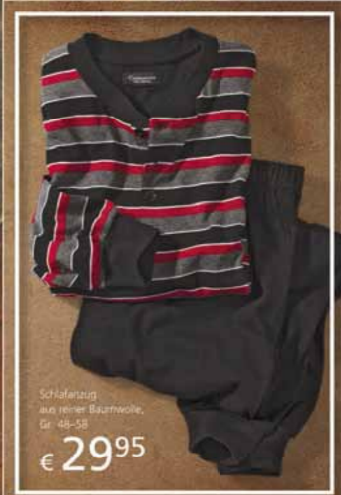
Schlafanzug aus reiner Baumwolle, Gr. 48-58 € 29 95