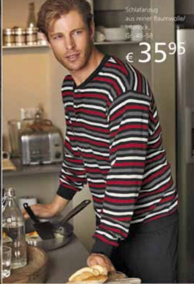
Schlafanzug aus reiner Baumwolle/ Interlock, Gr. 48-58 € 35 95